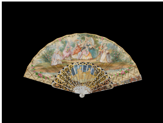
Détente au jardin Vers 1850 Éventail plié, feuille en peau, monture en nacre repercée, gravée et dorée H.t. 25 cm/ H.f. 11,5 cm