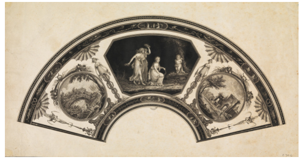
Feuille d'éventail à sujet mythologique et paysage