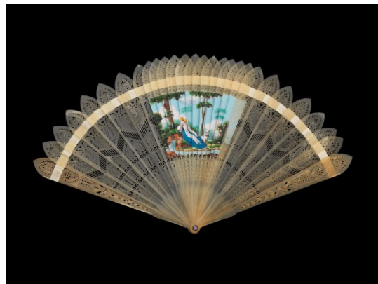
Éventail dit « double-entente » ou « quatre images » Vers 1820 Éventail de type brisé, corne repercée et gouachée, 15,4 cm