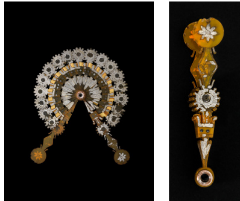
Éventail dit « cocarde » avec optique Vers 1800-1820 Corne, optique à la rivure, L. 20,5 cm/ D.15,5 cm