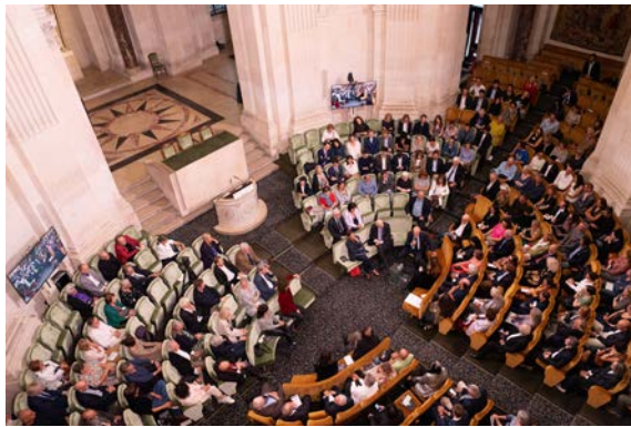
Cérémonie de remise du Grand Prix en cinéma et audiovisuel à Agnès Jaoui, 27 septembre 2023.

L'Académie des beaux-arts est l'une des 5 académies réunies à l'Institut de France. Accueillant 67 membres, 16 membres associés étrangers et 67 correspondants, elle veille à la défense du patrimoine culturel français et encourage la création artistique dans toutes ses expressions en soutenant de très nombreux artistes et associations par l'organisation de concours, l'attribution de prix, le financement de résidences d'artistes et l'octroi de subventions à des projets et manifestations de nature artistique. Instance consultative auprès des pouvoirs publics, l'Académie des beaux-arts conduit également une activité de réflexion sur les questions d'ordre artistique. Elle entretient en outre une politique active de partenariats avec un important réseau d'institutions culturelles et de mécènes. Afin de mener à bien ces missions, l'Académie des beaux-arts gère son patrimoine constitué de dons et legs, mais également d'importants sites culturels tels que, notamment, le Musée Marmottan Monet (Paris), la Villa et la Bibliothèque Marmottan (Boulogne-Billancourt), la Maison et les jardins de Claude Monet (Giverny), la Villa et les jardins Ephrussi de Rothschild (Saint-Jean-Cap-Ferrat), la Maison-atelier Lurçat (Paris), la Villa Dufraigne (Chars), l'Appartement d'Auguste Perret (Paris), ainsi que la Galerie Vivienne (Paris) dont elle est copropriétaire.