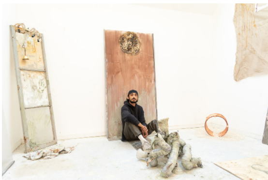
Pierre-Alexandre Savriacouty © Jean-Philippe Robin / ADAGP, Paris, 2023