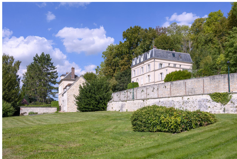
La Villa Dufraine © Académie des beaux-arts, Patrick Rimond

Extraits du texte Bonsoir Mémoire de Lou-Justin Tailhades, commissaire de l'exposition