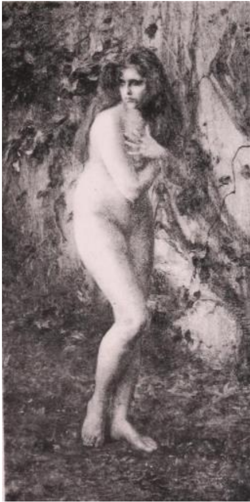
Alexis Axillette, Surprise , 1893