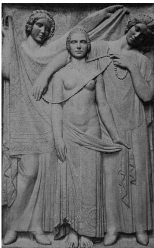
Fig. 1

Œuvres en rapport : Fig. 1. Armand Martial, Bas-relief pour le tombeau d'Édouard Souplet , 1925, bronze (Salon de 1925) dans La Revue de l'Art ancien et moderne , 1925, p. 60 ; Fig. 2. Tombeau d'Édouard Souplet , cimetière de Montparnasse dans L'Architecture , 15 août 1927, n°8, p. 256.