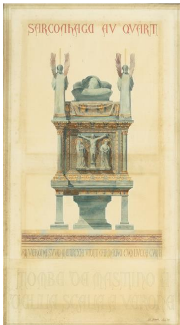
Charles Girault, Sarcophage au quart, tombe de Mastino II della Scala à Vérone « in verona suum marbrixia vidim marmareo cum lucca cum a, Roma », 1883