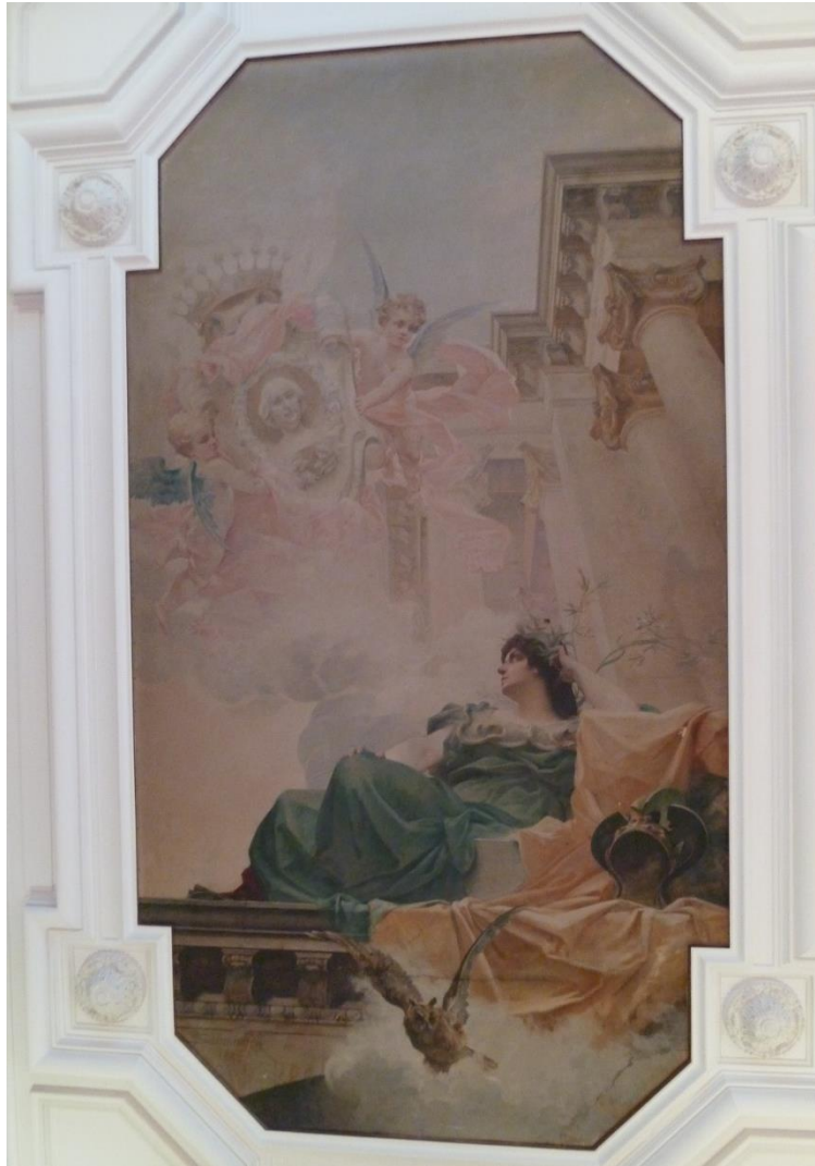
François Schommer, La Villa Médicis couronnant la comtesse de Caen , 1883.