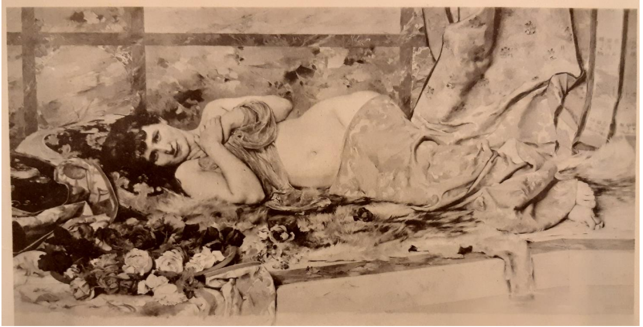
Gustave Popelin, Rêveries , 1890