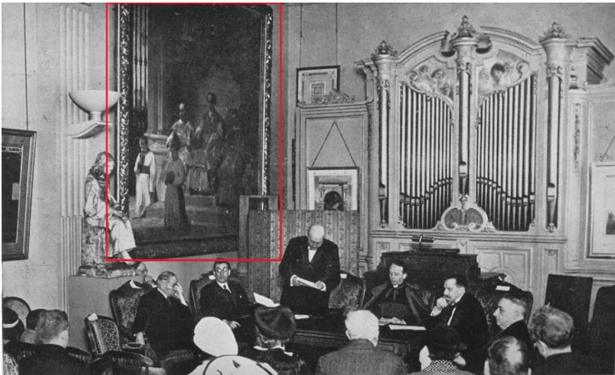
Séance d'ouverture du Congrès de musique sacrée le 19 juillet 1937 à l'Institut de France, musée de la comtesse de Caen