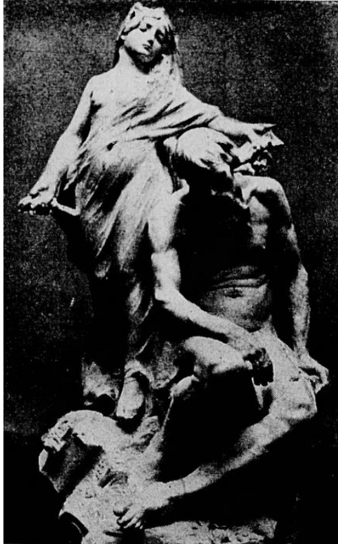
Louis Convers, La Légende et le passé , 1894