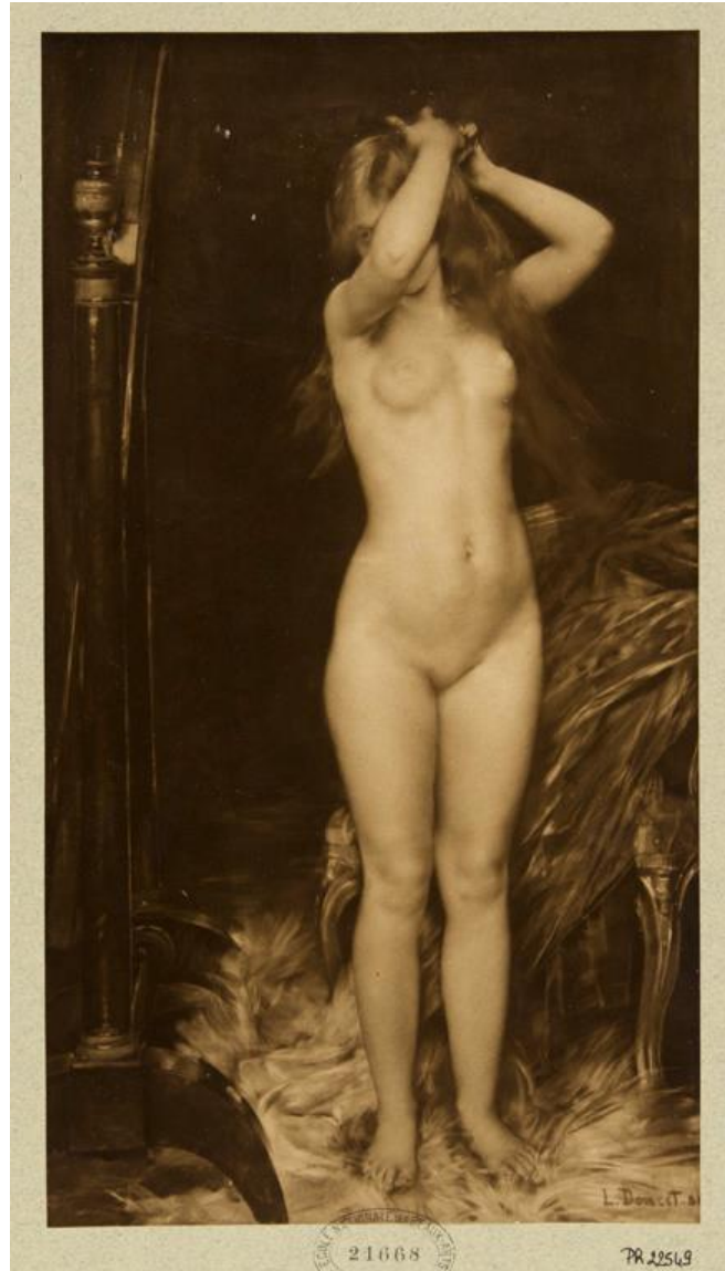
Lucien Doucet, Étude , 1887, photoglyptie, collections photographies Beaux-Arts de Paris (inv. Ph 22549)