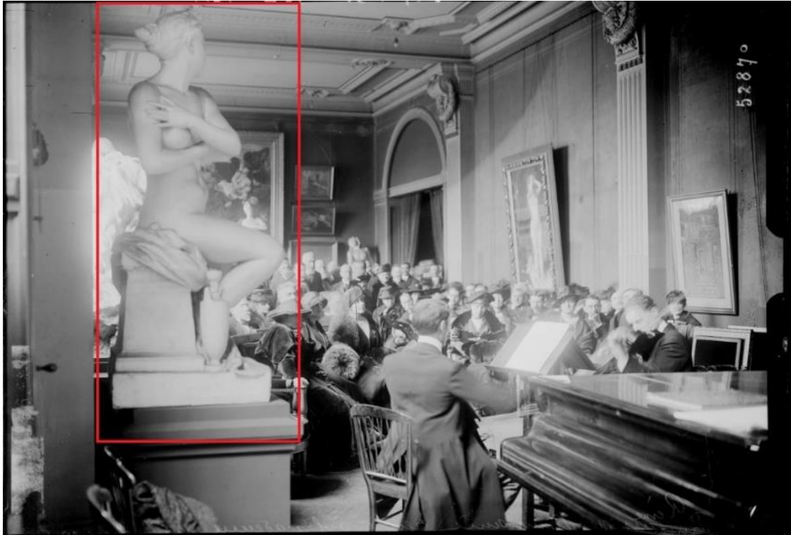
Concert donné au musée de Caen en l'honneur de la Reine Marie de Roumanie en 1919.