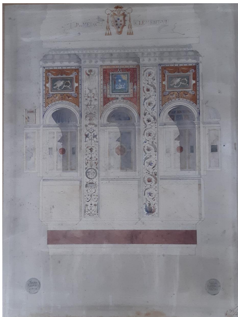
Pierre Esquié, Restauration d'une paroi de la Loggia de la Villa Madama , 1886. Photo documentaire