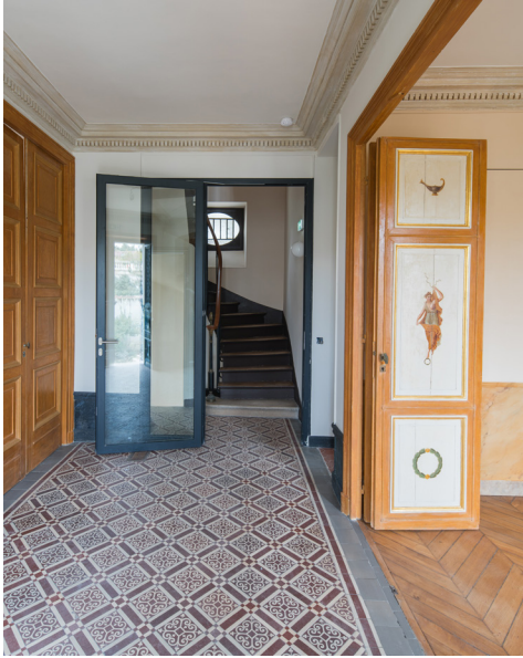
Vestibule