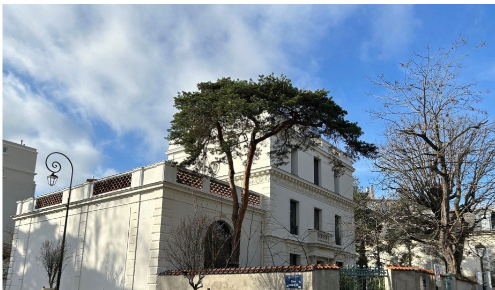
La Villa Marmottan

Propriété léguée en 1932 à l'Académie des beaux-arts par Paul Marmottan, historien, collectionneur et mécène, le site de la Bibliothèque et Villa Marmottan, situé à Boulogne-Billancourt, possède une remarquable collection de livres anciens, d'objets d'art, de meubles, d'estampes et de peintures. C'est aussi une bibliothèque vivante, riche de tous les titres récemment publiés sur la période de l'Empire.