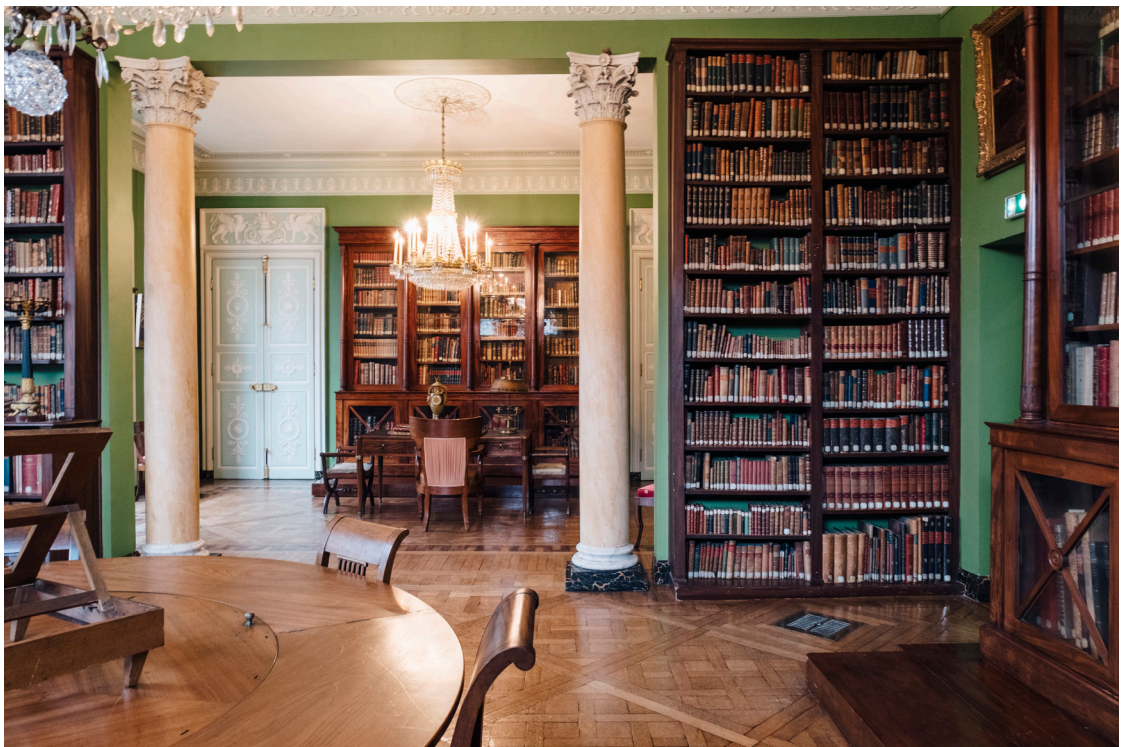
Vue de la Bibliothèque Marmottan avant rénovation

Elle entretient en outre une politique active de partenariats avec un important réseau d'institutions culturelles et de mécènes. Afin de mener à bien ces missions, l'Académie des beaux-arts gère son patrimoine constitué de dons et legs, mais également d'importants sites culturels tels que, notamment, le Musée Marmottan Monet (Paris), la Bibliothèque et Villa Marmottan (Boulogne-Billancourt), la Maison et les jardins de Claude Monet (Giverny), la Villa et les jardins Ephrussi de Rothschild (Saint-Jean-Cap-Ferrat), la Maison-atelier Lurçat (Paris), la Villa Dufraine (Chars), l'Appartement d'Auguste Perret (Paris) et la Galerie Vivienne (Paris) dont elle est copropriétaire.