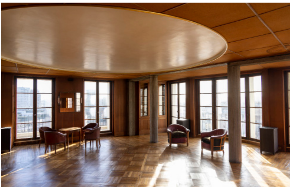
L'appartement d'Auguste Perret

Parallèlement à sa pratique, Bernard Desmoulin est, depuis 1995, architecte-conseil de l'État (DRAC Guyane). Il est maître de conférences à l'École nationale supérieure d'architecture de Paris-Val de Seine et intervient régulièrement à l'École de Chaillot. Il donne de nombreuses conférences en France et à l'étranger, où son travail est largement diffusé. Un ouvrage, Mais qui vous a promis un sommeil éternel ? , retranscrit sa leçon inaugurale prononcée en 2011 à l'École de Chaillot.