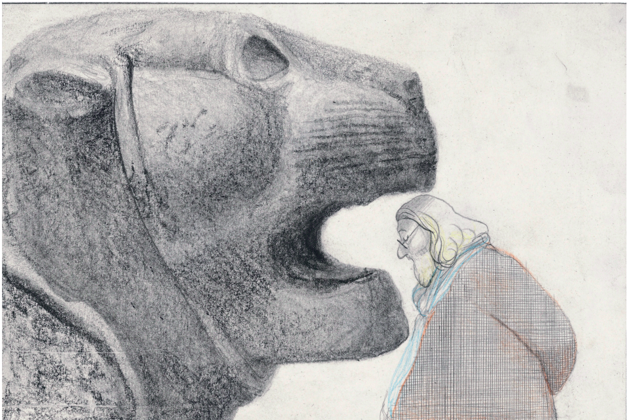
La Traversée du Louvre , p.60, David Prudhomme, 2012 / © Futuropolis / Musée du Louvre Editions / Dist. LA COLLECTION

La Galerie de l'Académie des beaux-arts (Galerie Vivienne, Paris II e )