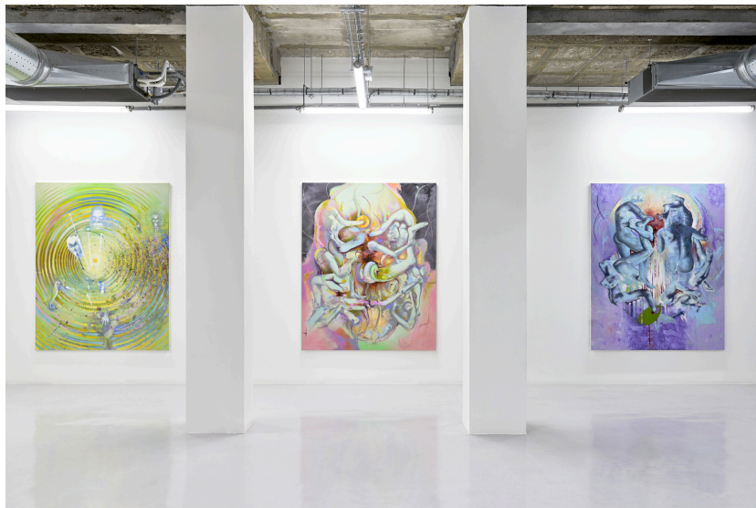
Bruno Perramant - LOVE'S MISSING, 2021 Vue d'exposition - © Thomas Lannes

Son travail, régulièrement présenté en France et à l'international (Centre Pompidou, Kunsthalle de Vienne, MAC/VAL, musées en Europe et en Asie), témoigne d'une reconnaissance institutionnelle constante, sans jamais céder aux effets de mode. Parallèlement à sa carrière artistique, il transmet son exigence en tant que chef d'atelier en peinture à l'École nationale supérieure des Beaux-Arts de Paris.