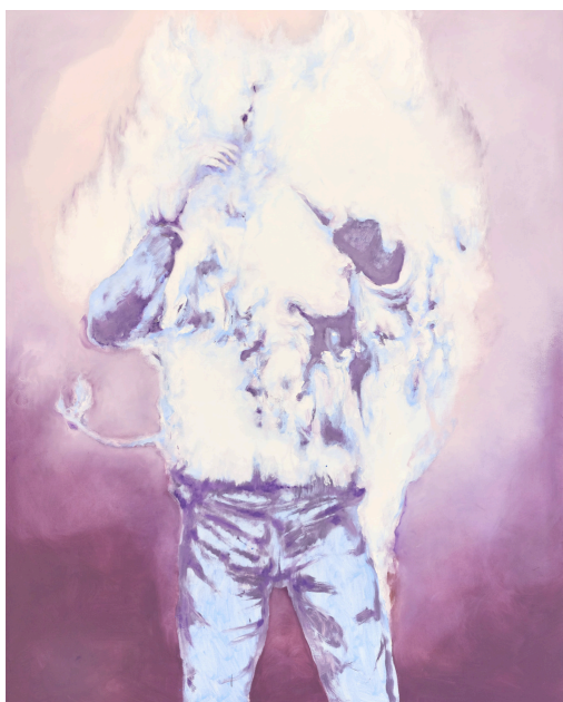
Bruno Perramant, Feu pâle n°2 , 2019 Huile sur toile 200 x 160 cm

La Fondation Simone et Cino Del Duca décerne chaque année, sur proposition de l'Académie des beaux-arts, un Grand Prix artistique qui récompense l'ensemble de la carrière d'un artiste de dimension internationale, alternativement dans les domaines de la peinture, sculpture et composition musicale. Ce prix est doté d'un montant de 100 000 €.