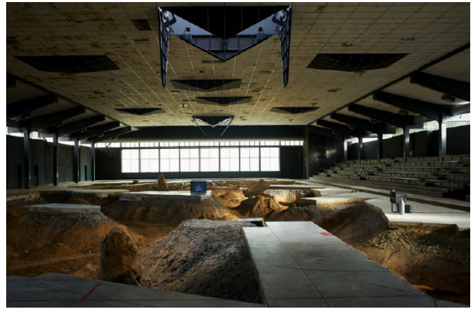
Pierre Huyghe, After Alife Ahead (2017). Patinoire en béton; Bactéries, algues, abeille, paon chimérique; Aquarium, verre noir commutable, textile conus; Incubateur, cellules cancéreuses humaines; Algorithme génétique; Réalité augmentée; Structure de plafond automatisée; Pluie; Ammoniac

Il est représenté par la galerie Chantal Crousel et par la galerie Hauser & Wirth. La Punta della Dogana - Collection Pinault lui consacre une exposition majeure Liminal , jusqu'en novembre 2024.