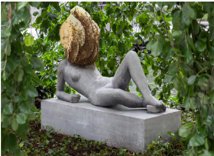
Pierre Huyghe, Untitled (Liegender Frauenakt) , 2012 Sculpture 75 x 145 x 45 cm / 29.5 x 57 x 17 7/10 in. Installation View : The Abby Aldrich Rockefeller sculpture garden The Museum of Modern Art, New York, 2015