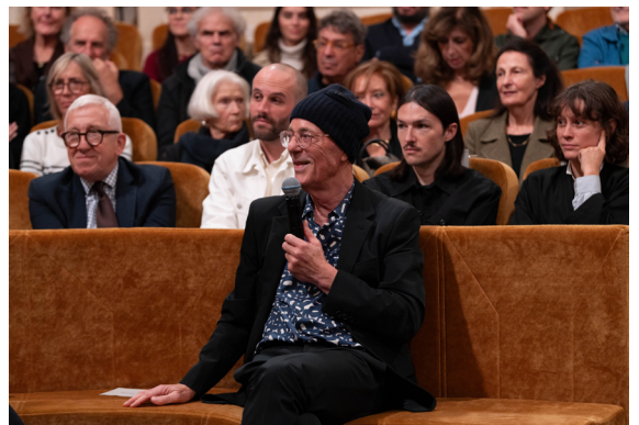
Remise du Grand Prix en Architecture à Herzog & de Meuron, le 15 octobre 2025