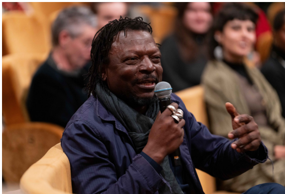
Remise du Grand Prix en Sculpture à Pascale Marthine Tayou, le 28 janvier 2026.