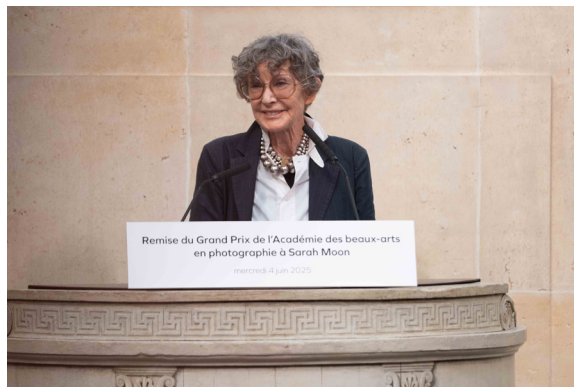
Remise du Grand Prix en Photographie à Sarah Moon, le 4 juin 2025