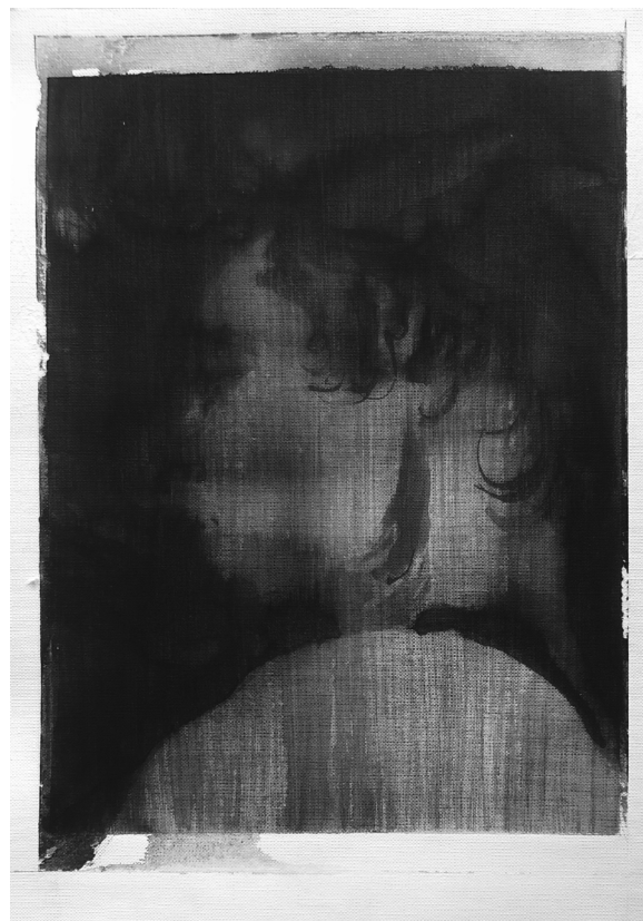
Lucas Ngo, Reflét n°5 , encre sur papier, 26 x 36 cm, 2022