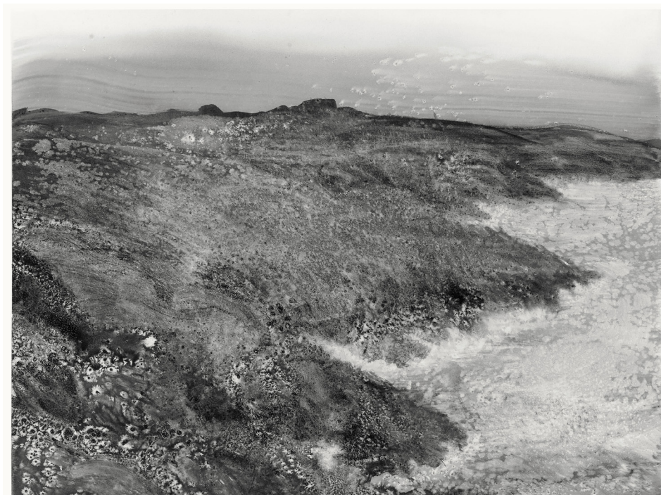
Yann Bagot, Pointe du Grouin #51 , encre de Chine sur papier, 56 x 76 cm, 2021, © ADAGP, Paris, 2023