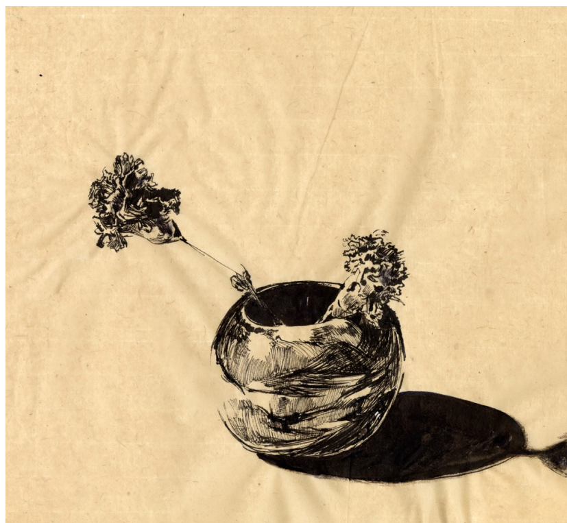
Arthur Dujols Luquet, Ce qui fleurit de l'encre - Pot rond et fleurs crépues , encre de Chine sur papier bambou monté sur papier canson, 29,9 x 27,8 cm, 2023