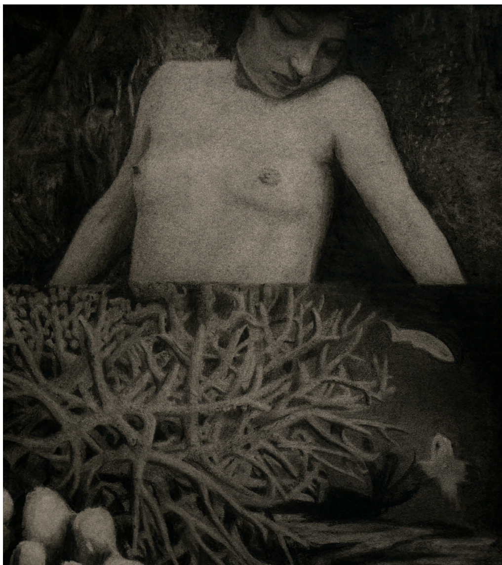
Alexis Frémont, Sans titre , pierre noire sur papier, 54 x 48 cm, 2022