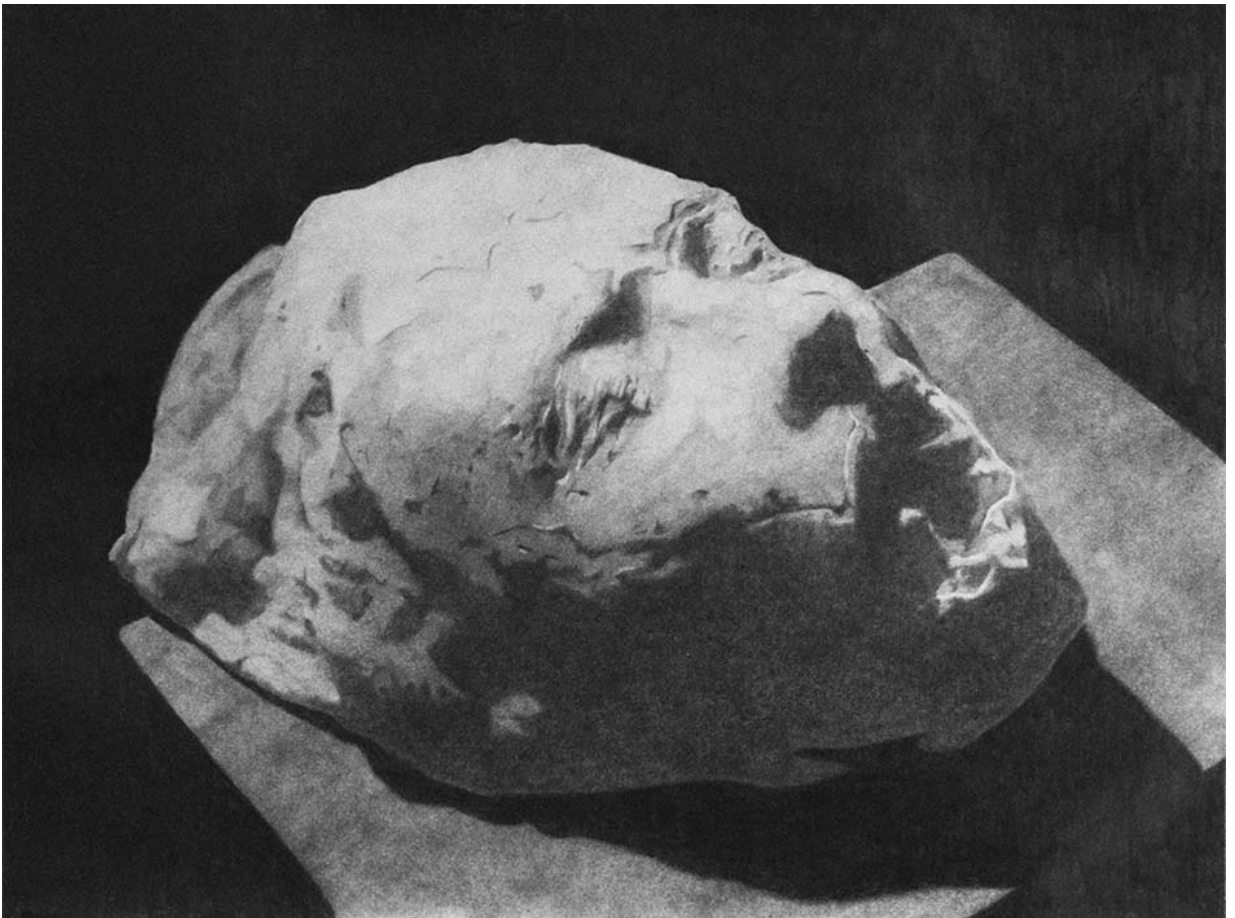
Cassius Baron, Sans titre , plomb et graphite sur papier, 30 x 40 cm, 2022