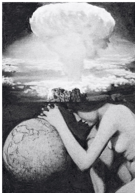
Alexis Frémont, Sans titre , pierre noire sur papier, 63 x 44 cm, 2021

(Pavillon Comtesse de Caen, Palais de l'Institut de France)