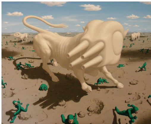
Pierre Monestier, La révolte , 2008