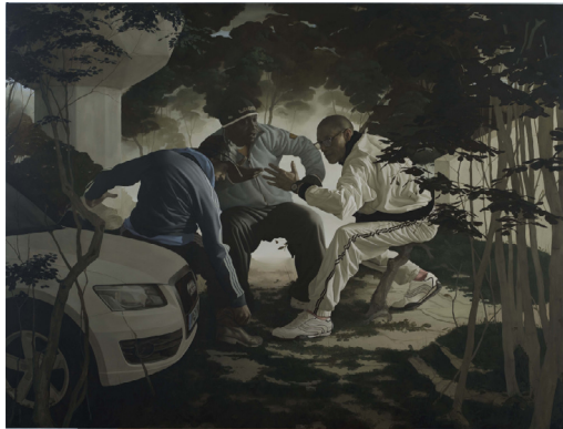
Guillaume Bresson, Sans titre , 2010