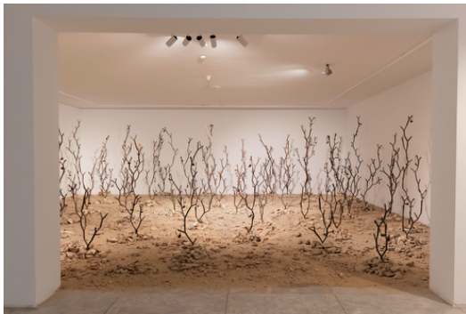
© Kader Attia, Intifada: The Endless Rhizomes of Revolution , 2016. Le Paradis Perdu , CAAC Sevilla.

Lauréat du Prix Marcel Duchamp en 2016, exposé dans les plus grandes institutions internationales et invité à plusieurs reprises à la Biennale de Venise, il s'impose comme une voix essentielle de l'art contemporain.