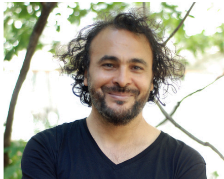
Kader Attia © Nicole Tanzini di Bella