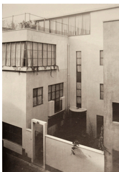
La maison-atelier de Jean Lurçat, villa Seurat, vers 1926.