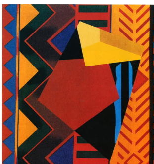
Angle jaune sur flamboyant , 1987 Acrylique sur toile imprimée

Ancien élève de l'École nationale supérieure des Arts Décoratifs de Paris, Guy de Rougemont séjourne deux années à la Casa de Velázquez (1962-1964).