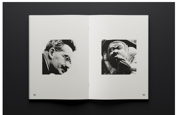
Le Projet d'Architecture à l'Âge de sa Simulation crédible - proposition de livre, rendus, 2023