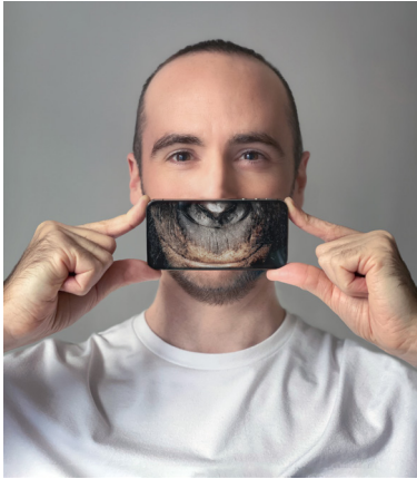
Man, Monkey and Screen, 2021 © CompMonks

CompMonks est architecte diplômé de l'ENSA Paris-Malaquais, docteur en sciences et technologies pour l'architecture à l'ETH de Zürich et artiste visuel nouveaux médias. Après avoir travaillé à l'agence Gehry Technologies sur de multiples projets culturels aux géométries complexes et de grande ampleur, il a enseigné comme maître-assistant associé à l'ENSA Paris-Malaquais et maître de conférences à l'EPFL de Lausanne. Son processus de création s'attache à articuler les problématiques artistiques aux questions scientifiques liées aux neurosciences et la conception du monde physique. Ses travaux se déclinent au fil de séries d'objets de design et d'installations aux médias mixtes qui forment des dispositifs interactifs et génératifs pour exprimer la puissance créatrice de la cognition humaine combinée à l'ordinateur.