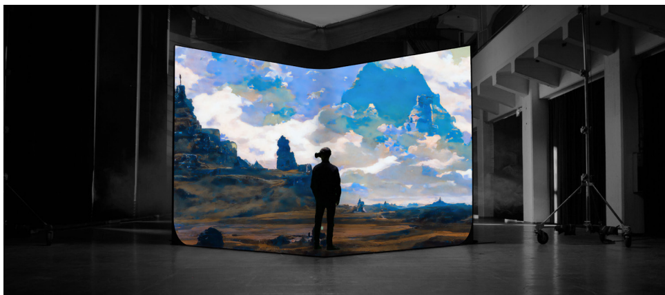
L'attrape-rêve, installation médias mixtes, 2023 © CompMonks