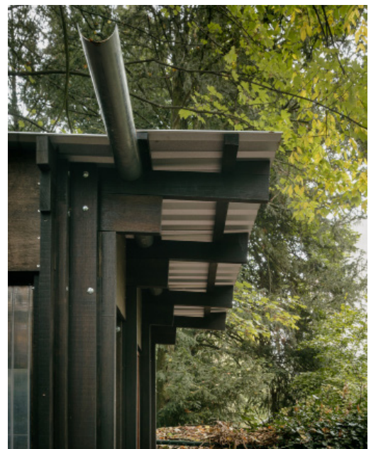
Expérimentations à l'échelle 1 réalisées par Studio ACTE