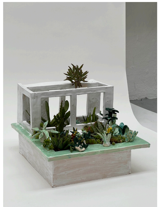
Ceramic gardens Model , maquette en céramique et plantes grasses réalisée par Sophie Dars et Éléonore Morand (2022).