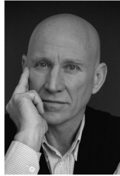
Sebastião Salgado © UNICEF, Nicole Toutounji