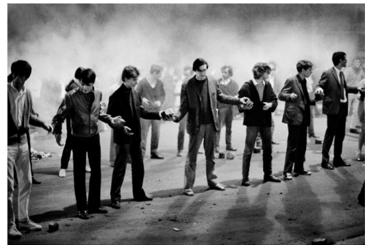
Paris, le 10 mai 1968, rue Gay Lussac. Des étudiants font une chaîne et déplacent des pavés afin de monter une barricade