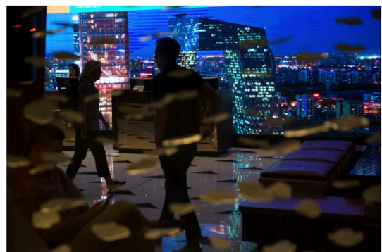
Pékin, 2017. CCTV Tower