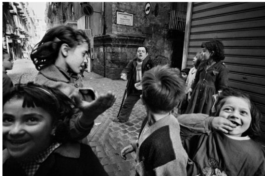
Naples, 1962. Enfants avec un mendiant