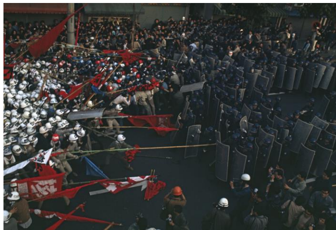
Tokyo, 1971. Manifestation contre la construction de l'aéroport de Narita et contre la guerre au Vietnam