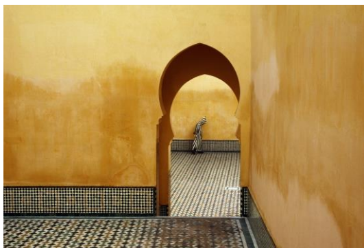
Meknès, 1985. Mausolée de Moulay Ismaïl