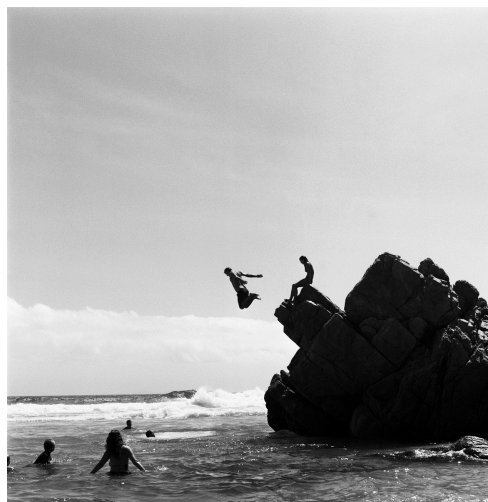
Les plongeurs, Koeëlbaai, Western Cape, Afrique du Sud, 2013