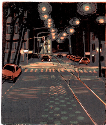
Plantage, Amsterdam, gravure sur bois en couleurs, 18 x 21 cm, 2018

PRIX DE GRAVURE MARIO AVATI-ACADÉMIE DES BEAUX-ARTS INSTITUT DE FRANCE