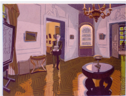
Hôtel Turgot, l'entrée, gravure sur bois en couleurs, 30 x 40 cm, 2009