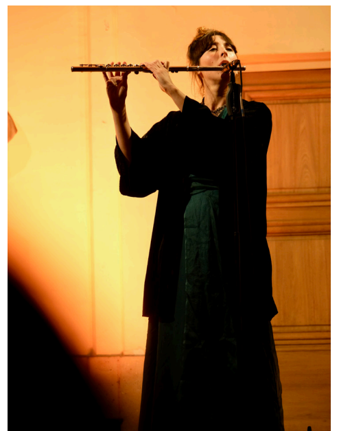
Nuit Blanche 2024 : hommage à Gabriel Fauré / Nuit blanche 2025 : Le Sacre du Printemps par la compagnie Blanca Li