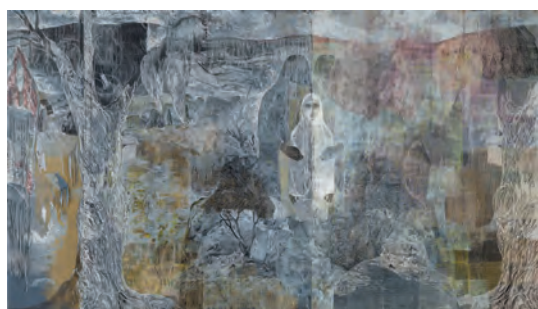
La fille et l'épine , linogravure-PVC relief, 200 x 350 cm, 2017