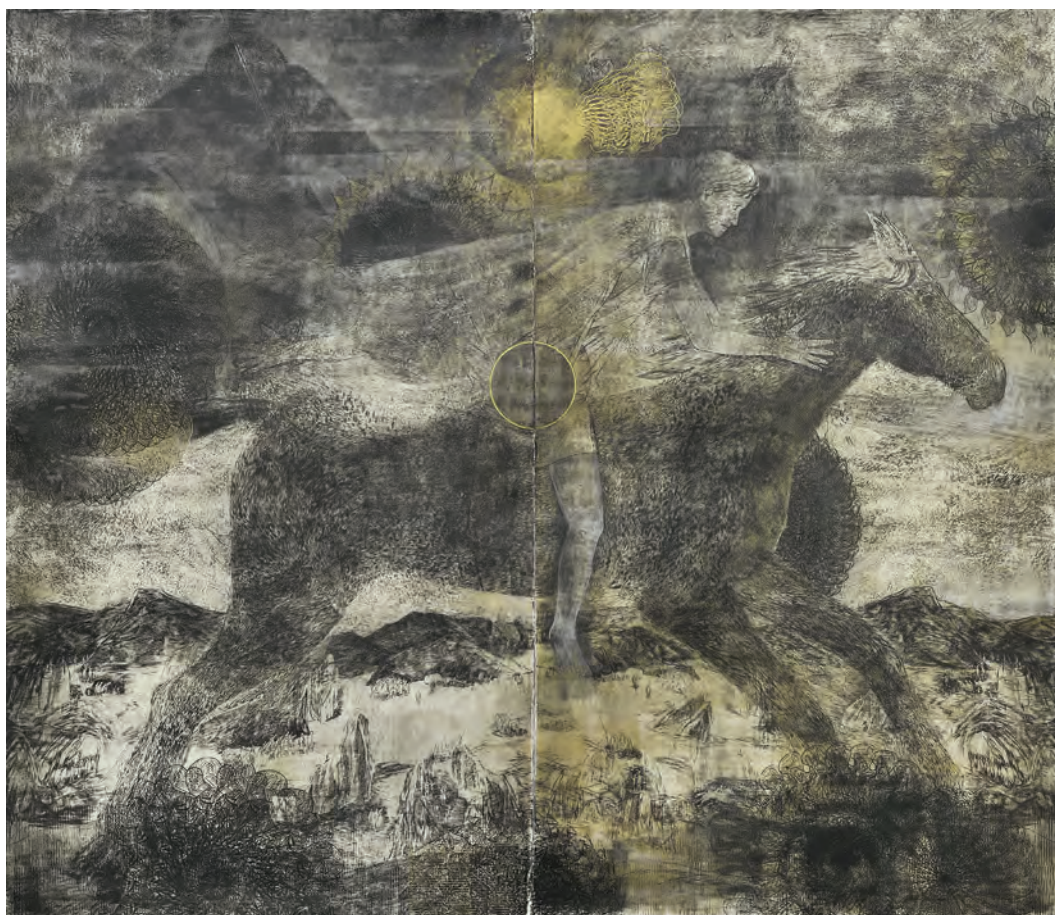
Du cycle J'ai voulu être général, mais la guerre a été trop courte , Le cavalier , linogravure, 215 x 246 cm, 2014

du 5 mai au 6 juin 2021 Pavillon Comtesse de Caen, Palais de l'Institut de France