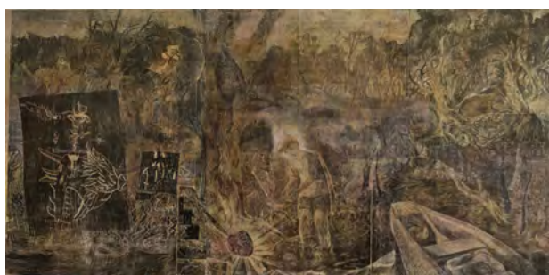
Un cœur dans la rivière , linogravure, 210 x 400 cm, 2016