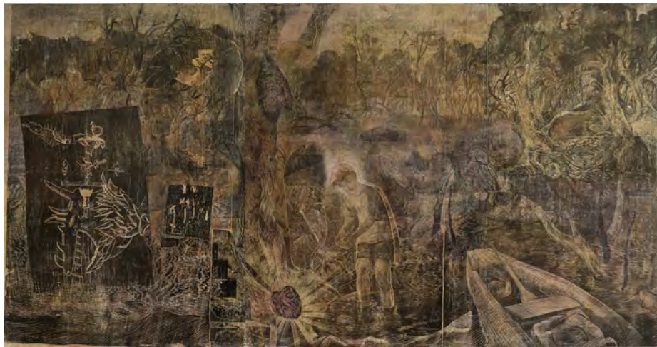
Un cœur dans la rivière , linogravure, 210 x 400 cm, 2016