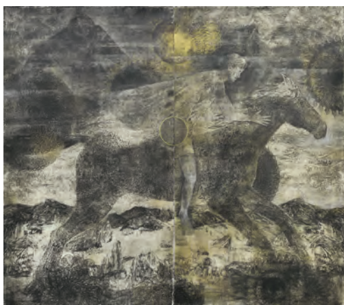
Du cycle J'ai voulu être général, mais la guerre a été trop courte , Le cavalier , linogravure, 215 x 246 cm, 2014