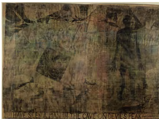
J'ai vu un homme dans la grotte de la Montagne du Diable , 220 x 340 cm, gravure sur bois, 2003