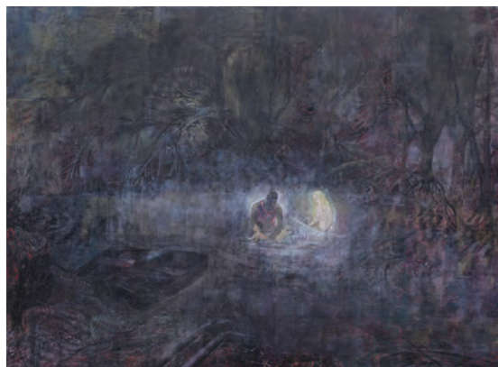
La baignade dans la rivière , linogravure, 90 x 120 cm, 2017