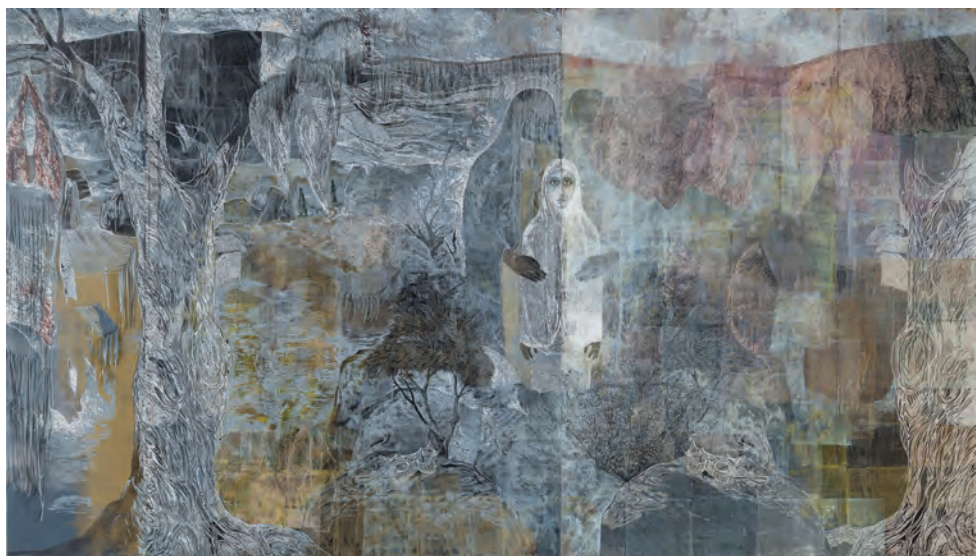
La fille et l'épine , linogravure-PVC relief, 200 x 350 cm, 2017

Je m'arrête sous un arbre dans le désert, à proximité d'une tente nomade. Je fais chauffer un café et je me roule les pouces. Après un moment, un homme arrive avec ses trois enfants. La fille a une de ses jambes bandée. Son père essaie de m'expliquer quelque chose en montrant la jambe. Il enlève le torchon sale sous lequel il y a des herbes médicinales, je comprends à ce moment là que sa fille est touchée d'une grave infection. Elle s'est blessée en marchant sur une épine. Sa jambe est toute blanche et gonflée du pied au genou. J'essaie d'expliquer à cet homme que sous peu de temps la jambe va devenir bleue car elle est sans doute atteinte d'une septicémie; elle risque de devoir être amputée. L'homme ne comprend pas, il ignore jusqu'à l'existence des antibiotiques que sa fille devrait immédiatement commencer à prendre. Je lui donne des remèdes Ibalgin, Paralen et des bandages propres. Je lui propose de transporter sa fille à l'hôpital de Zagora qui se trouve à 80 kilomètres et lui dis que je suis prêt à payer le traitement. L'homme refuse. Je lui donne encore au moins 300 dirhams. Ils m'invitent en retour à boire du thé dans leur tente. Derrière la tente il y a quelques chèvres et poules et un troupeau de brebis. Ils sont très pauvres.