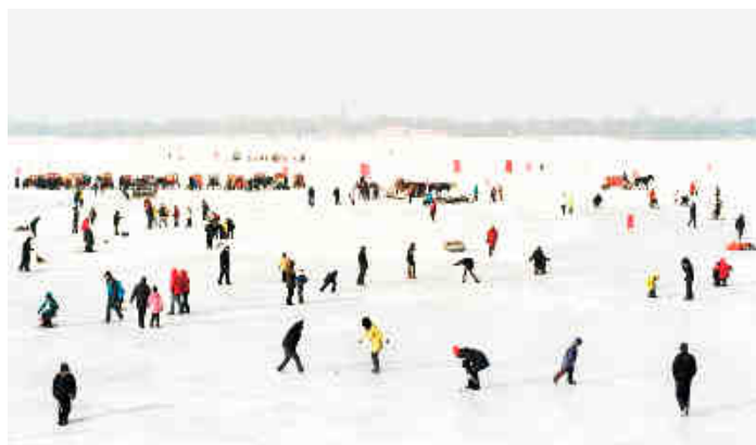
© Catherine Henriette, Les Toupiés , janvier 2012