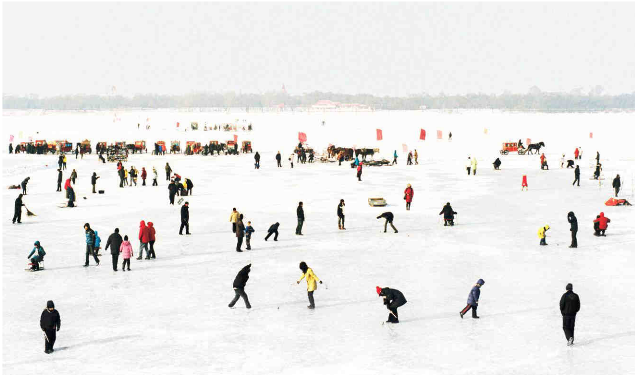
Les toupies , janvier 2012

PRIX DE PHOTOGRAPHIE MARC LADREIT DE LACHARRIÈRE - ACADEMIE DES BEAUX-ARTS