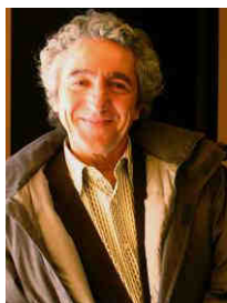
Jean-Marc Tingaud

Les œuvres de Jean-Marc Tingaud ont été exposées à l'International Center of Photography à New York, chez Parco Exposure et à la Bunkamura Gallery à Tokyo, à la Biennale Internationale de Turin, au Centre National de la Photographie et au Palais de Tokyo à Paris, aux Rencontres Internationales de la Photographie d'Arles... Elles figurent dans de nombreuses collections publiques et privées dont, en France, celles du Centre National d'Art Contemporain, du Centre Pompidou et de la Fondation d'entreprise Hermès.