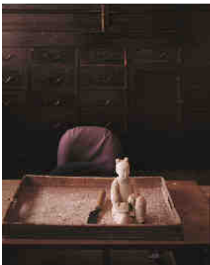
© Jean-Marc Tingaud, Un monde, Kyoto, Japon , 2009 (Collection Fondation d'entreprise Hermès)

Passionné d'art, autodidacte, je n'ai eu de cesse de décrire, par-delà les frontières, les intérieurs, lieux d'habitation ou de travail, de mes contemporains. C'est cette humanité discrète et anonyme, riche d'inspiration, de sensibilité et de poésie, que je veux continuer d'explorer aujourd'hui. La quête des représentations de cette intimité, dans des lieux simples, est le fil d'Ariane de ce parcours. Elle s'exerce dans des pays de cultures différentes, généralement dans le cœur des villes. Il ne s'agit pas seulement pour moi d'inventorier d'un point de vue documentaire des espaces de vie qu'on pourrait rapprocher de natures mortes, même si l'image raconte à sa manière un contexte social, des cultures, des religions... L'idée que chacune d'elles soit une sorte de portrait guide à la fois ma recherche et ma pratique photographique. Après avoir terminé en décembre 2012 une série intitulée Lieux inspirés, Trésors vivants du Japon avec le soutien de la Fondation d'entreprise Hermès, je souhaite maintenant poursuivre vers des Confins : en Afrique de l'Est à Zanzibar, en Russie à Vladivostok et en Chine, à Shanghai et dans la province autonome du Tibet, parties du monde encore absentes de mon travail.