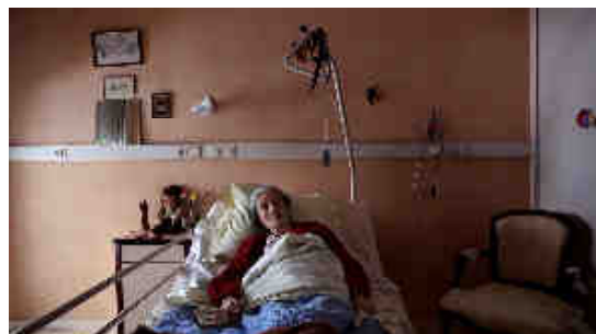
© Lucie & Simon, Living images, Memory of a life , 2009. Vidéo couleur