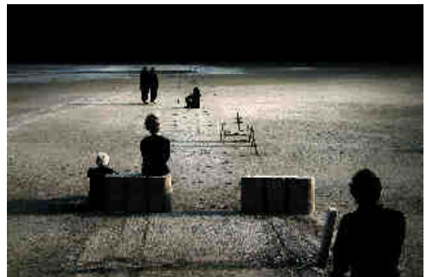
© Corinne Mercadier, série Solo , Les planètes , 2013