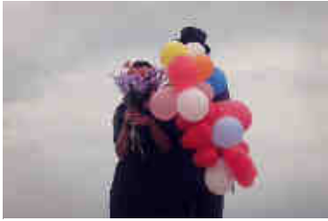
Lucie&Simon, Lac Balaton, Hongrie, 2010

« Etablis à Paris, Lucie & Simon travaillent ensemble depuis 2005. Ils forment un duo d'artistes contemporains utilisant la photographie, la vidéo et les installations. Leurs projets s'articulent en ensembles qui déjouent notre mode de perception du réel par une mise en scène décalée du quotidien. Solitude urbaine ou familiale, errance existentielle, incommunicabilité des êtres, les compositions captent sous différents jours la mélancolie silencieuse de l'homme, traduisent l'interstice ténu séparant son existence du monde rêvé. Dans un univers énigmatique, chaque personnage semble appartenir à un temps suspendu, apparaît comme noyé dans l'atemporalité des songes. »