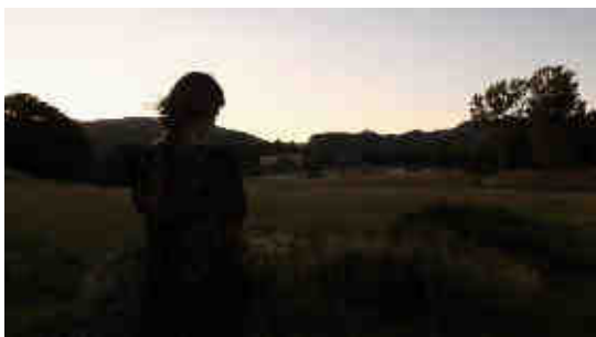
© Lucie & Simon, Living images, A silent contemplation , 2012. Vidéo couleur

Quelle est l'évolution dans le temps d'un regard exprimé par une personne qui fait face à la camera pendant de longues minutes, immobile ? Nous continuerons, dans ce nouveau chapitre, notre réflexion sur le temps et l'espace-temps, en les confrontant à l'évolution actuelle des mediums artistiques et l'essor de la vidéo comme outil d'enregistrement du temps continu.