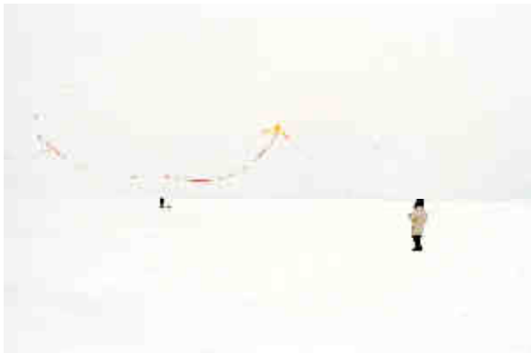
© Catherine Henriette, Le cerf-volant , janvier 2012

Catherine Henriette est née en 1960 en France. Elle vit et travaille à Paris.