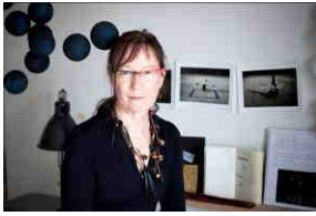
Corinne Mercadier

L'œuvre photographique de Corinne Mercadier est liée jusqu'en 2008 au Polaroid SX 70. À partir de ces clichés, elle réalise des tirages agrandis de différents formats qu'elle recompose et rephotographie. À partir de 2000, elle commence à dessiner, puis à fabriquer des sculptures souples destinées à être lancées et photographiées. Son univers proche du cinéma mêle la poésie au rêve aux confins du surréalisme. En 2008, elle expérimente des outils numériques qui apportent des modifications fondamentales aux dispositifs de prise de vues et à l'esthétique de ses images.