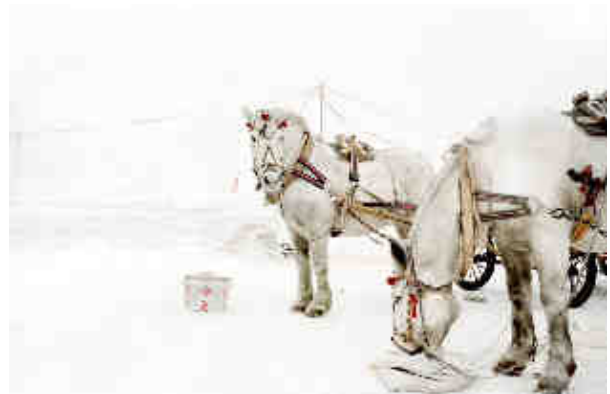
© Catherine Henriette, Les chevaux , janvier 2012