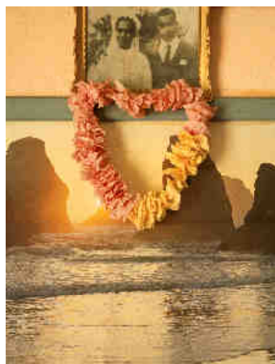
© Jean-Marc Tingaud Un monde, Ile de Maré, Nouvelle Calédonie , 1990