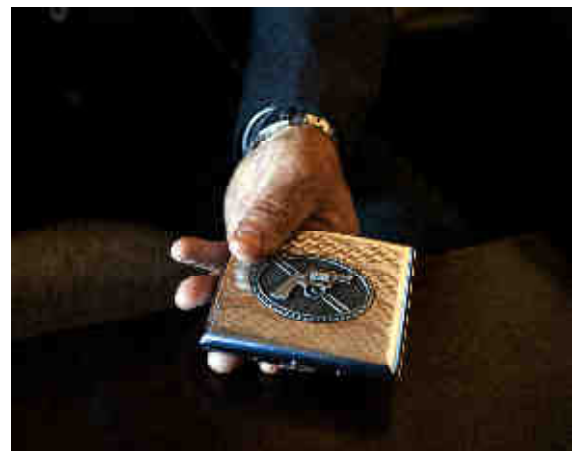
© Guillaume Herbaut, Boîte à cigarettes du pacificateur Pjeter Gjoka