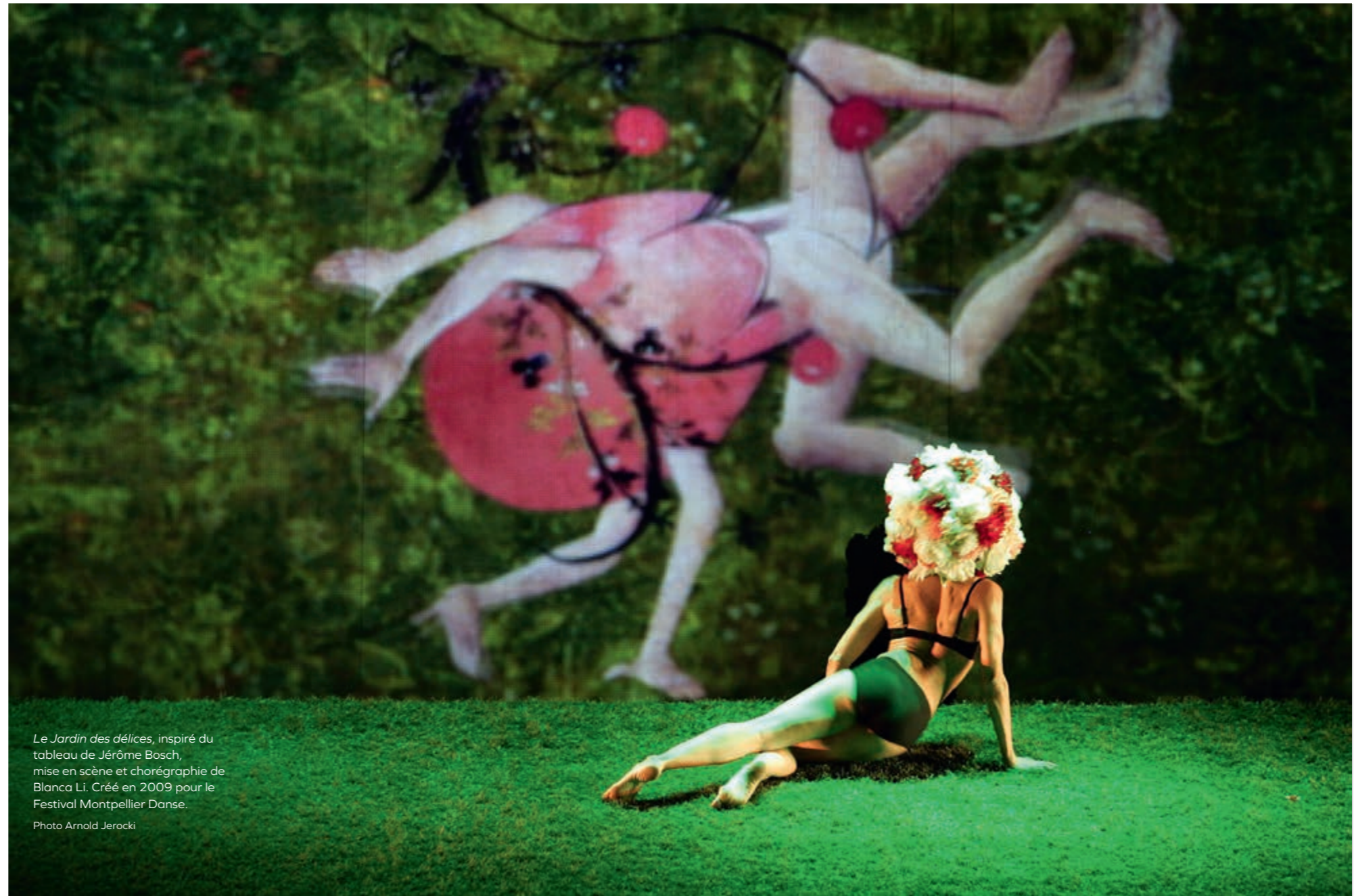
Le Jardin des délices , inspiré du tableau de Jérôme Bosch, mise en scène et chorégraphie de Blanca Li. Créé en 2009 pour le Festival Montpellier Danse.

B.L. : Quand j'ai décidé de devenir danseuse, c'était pour devenir aussi chorégraphe. Dans mon parcours artistique, j'ai toujours eu l'envie de créer en même temps que d'être sur scène, donc ce sont deux choses qui ont toujours été pour moi simultanées. Bien sûr il y a eu ensuite des spectacles où je ne suis pas sur scène et où je suis seulement chorégraphe, et des spectacles où je prends plaisir à interpréter en toute liberté, en improvisant et en m'amusant, et dans lesquels mon côté chorégraphe est relégué au