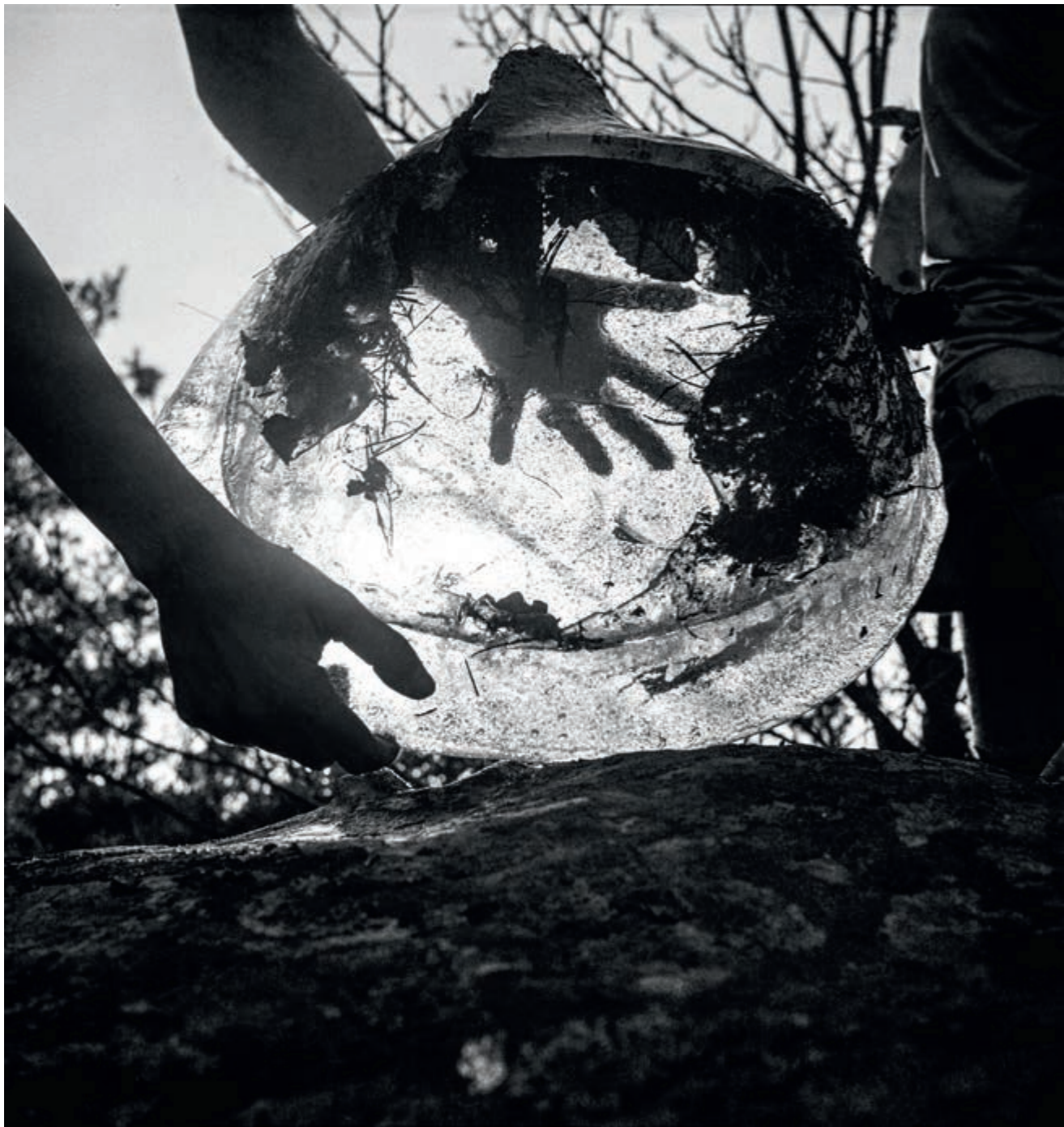
Ci-dessus : Bloc de glace dans la forêt de Fontainebleau, vers 1935.