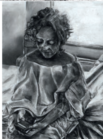
Jérôme Minard, Fuir et disparaître , 75 x 55 cm, encre sur papier, 2018.